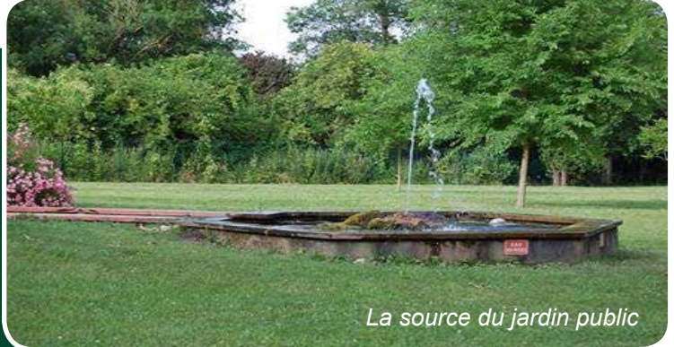
La source du jardin public